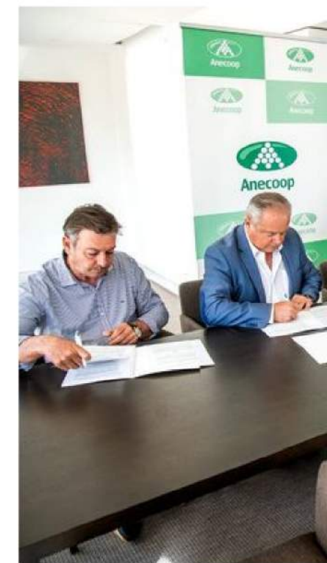
Firma del acuerdo HortiGO2 con Ar tribunal de las aguas.

Nace para ayudar a nuestro entorno inmediato de forma colaborativa a buscar una vía de apoyo al mantenimiento de la actividad en la huerta valenciana