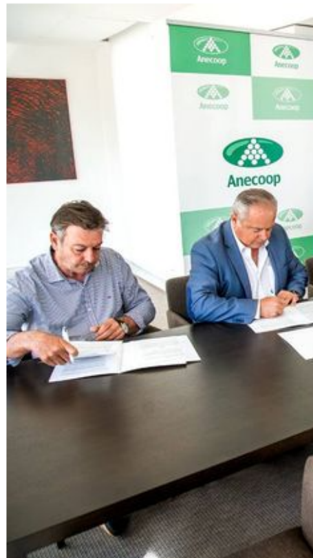
Firma del acuerdo HortiGO2 con Ar tribunal de las aguas.

Nace para ayudar a nuestro entorno inmediato de forma colaborativa a buscar una vía de apoyo al mantenimiento de la actividad en la huerta valenciana